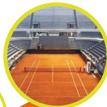
FORO ITALICO (ROMA-ITALY)