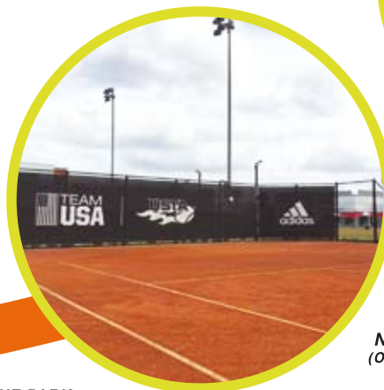
USTA National Campus (ORLANDO-FLORIDA)